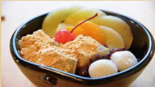
わらびあんみつ 700円(税込)

鎌倉わらび餅とオリジナル小豆、白玉を使い 自家製の黒みつをたっぷり使った自信作です。