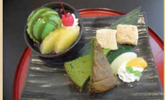
抹茶パフェ 820円(税込)