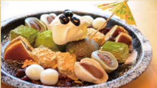
鎌倉贅沢パフェ 1,050円(税込)

鎌倉の甘味をふだんに使った贅沢なパフェ。 1人で贅沢に食すもよし、2~3人でシェアするのも おすすめです。