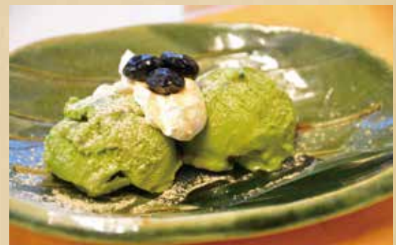
鎌倉アイス 360円(税込)