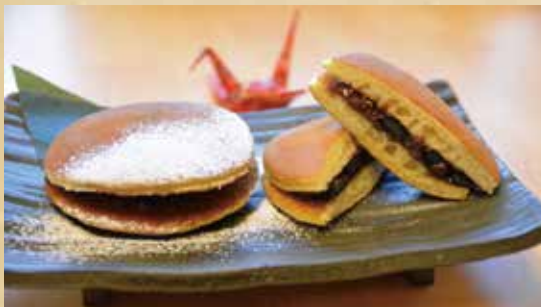
黒豆みかさ 470円(税込)

しっとりとした三笠の生地に、存在感たっぷりの 丹波種の黒豆を混ぜ込んだあんこをサンドしました。