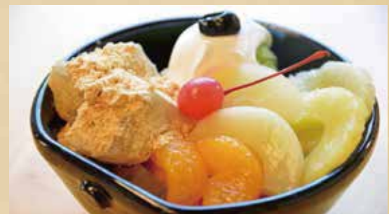
抹茶クリームあんみつ 750円(税込)

鎌倉わらび餅とオリジナル小豆、白玉を使い 自家製の黒みつをたっぷり使った自信作です。