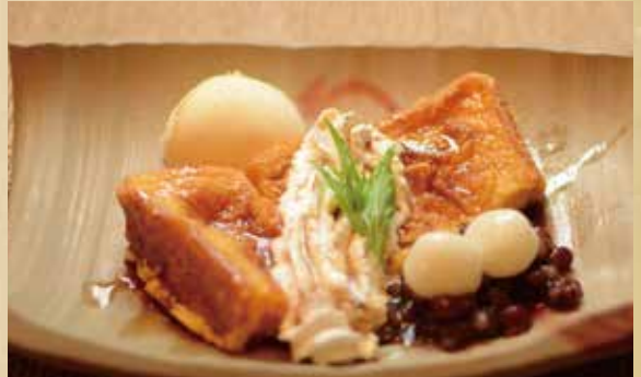
フレンチトースト 600円(税込)