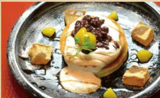
鎌倉パンケーキ 640円(税込)