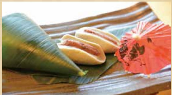
麩まんじゅう 360円(税込)

しっとりとした三笠の生地に、存在感たっぷりの 丹波種の黒豆を混ぜ込んだあんこをサンドしました。