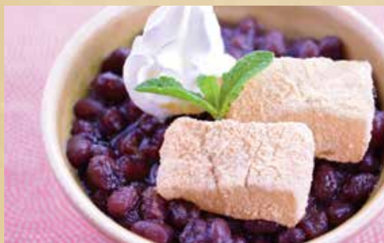
抹茶豆乳プリン 450円(税込)