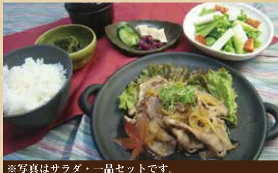
※写真はサラダ・一品セットです。