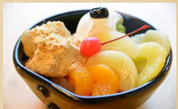
抹茶クリームあんみつ 680円(税込)