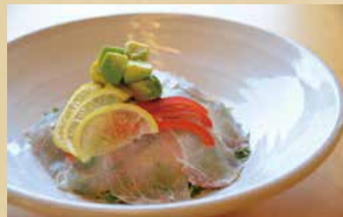
生ハムとアボガドのチーズごはん 800円 (税込)