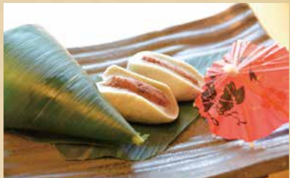
麩まんじゅう 300円(税込)