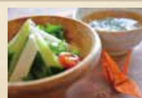
スープサラダセット +200円 (税込)

珈琲 (hot or ice) / 紅茶 (hot or ice) / りんごジュース / オレンジジュース / 抹茶