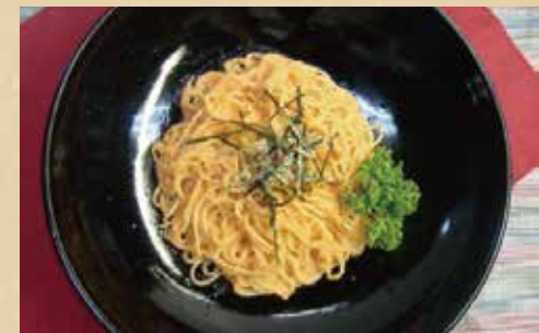
明太クリームパスタ 800円 (税込)