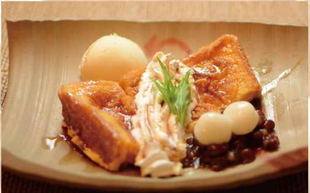
フレンチトースト