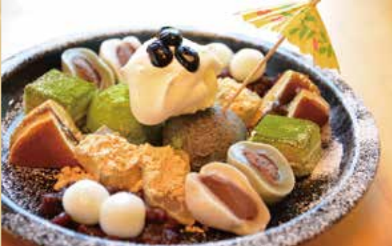
鎌倉贅沢パフェ 880円(税込)