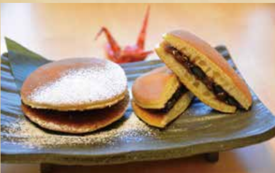
黒豆みかさ 400円(税込)