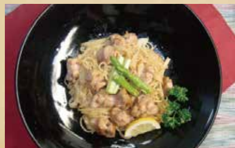
鶏の柚子胡椒パスタ 800円 (税込)