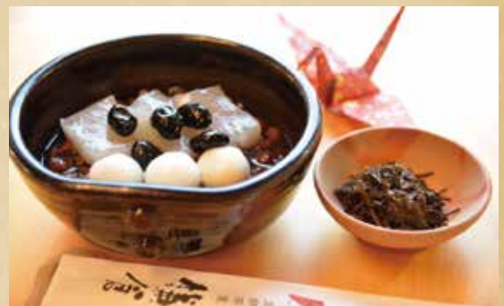
鎌倉ぜんざい 580 円 (税込) 【温 or 冷】