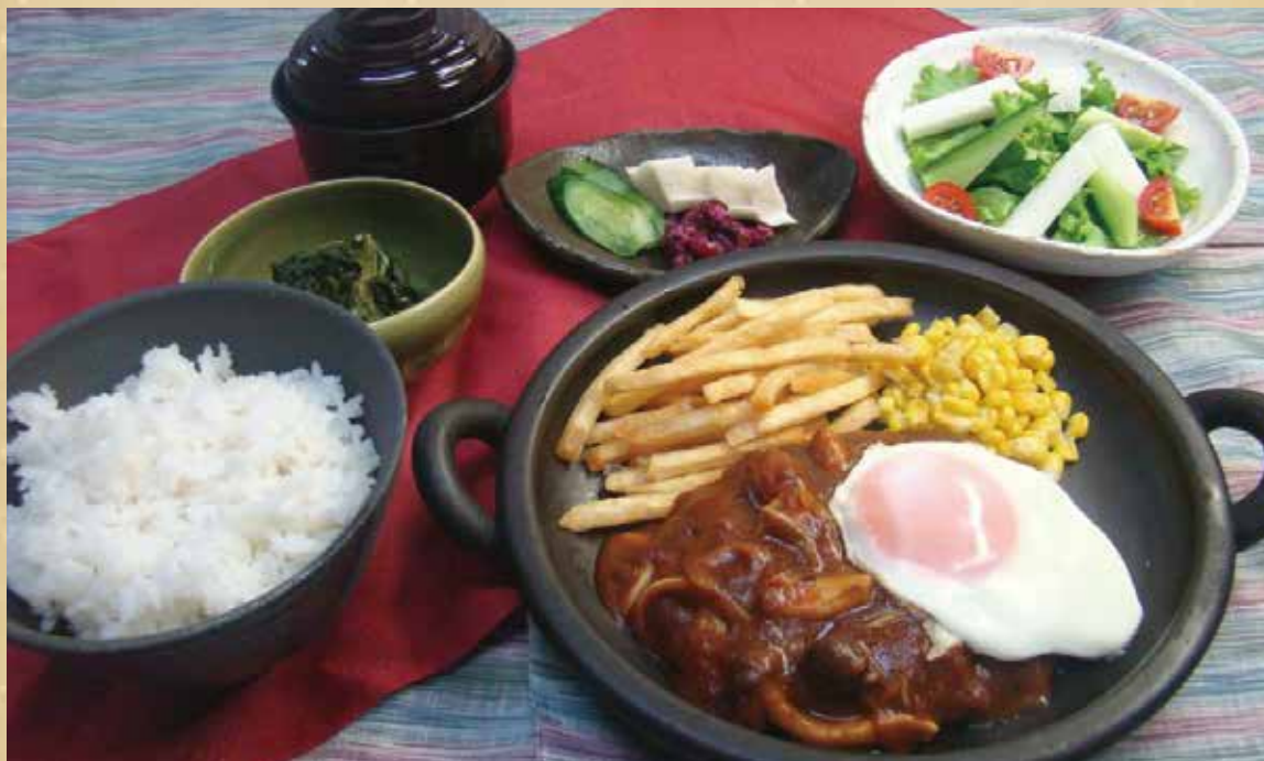
※写真はサラダ・一品セットです。