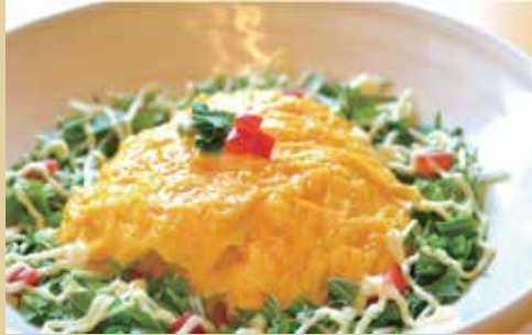
オムライス 800円 (税込)