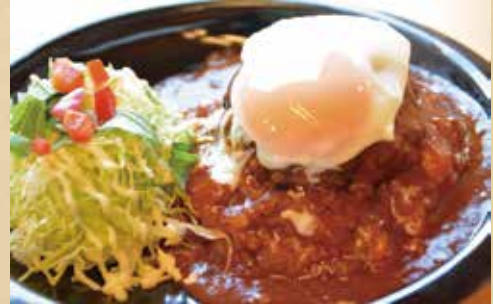
ロコモコ 800円 (税込)