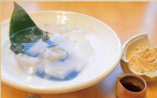
冷やしわらびもち 530 円 (税込)