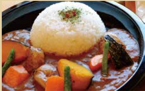
彩り野菜カレー 800円 (税込)