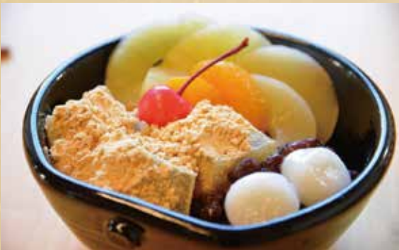
わらびあんみつ 580円(税込)