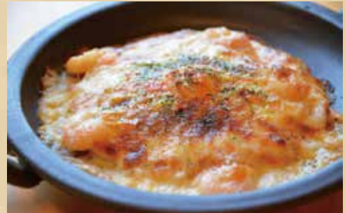
小エビのドリア 800円 (税込)