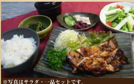
※写真はサラダ・一品セットです。